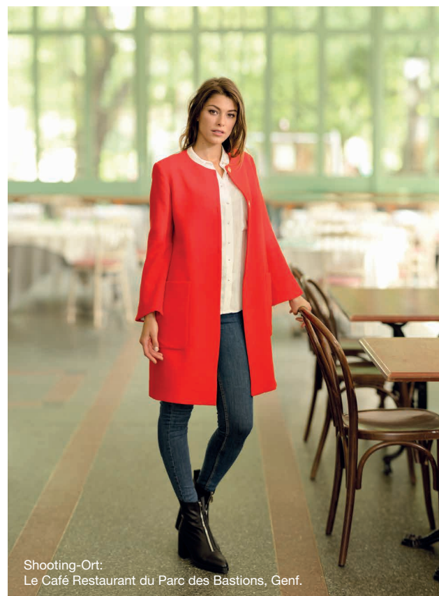
Shooting-Ort: Le Café Restaurant du Parc des Bastions, Genf.

Zusätzlich ist die Version 570α mit einem Alphabet mit Klein- und Großbuchstaben, Zahlen und Zeichen ausgestattet. Mit der Speicherfunktion können Sie einzigartige StICKombinationen erstellen und Texte und Namen programmieren.